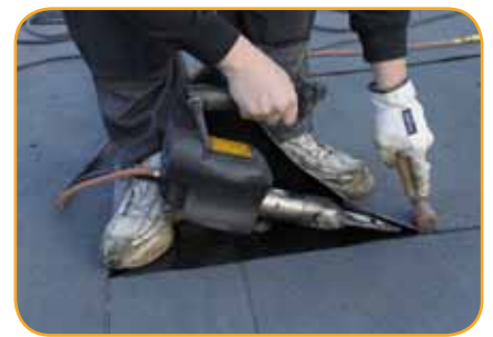
Kaasu- ja sähkökäyttöinen kuumailmatyökalu