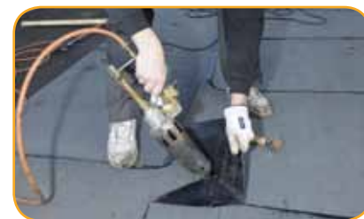
Modifioidun bitumin hitsaus