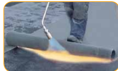
Tehopoltin bitumikermin hitsauksessa