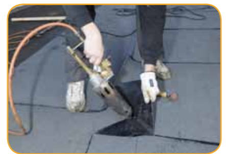
Kaasukäyttöiset ns. liekittömät kuumailmapoltinsarjat