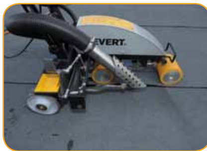
Kaasu- ja sähkökäyttöinen kuumailmahitsauskone